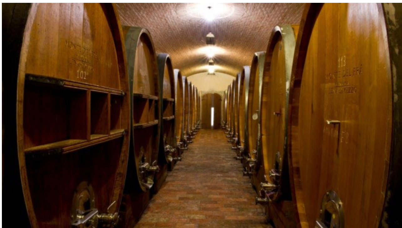
Monte del Frà