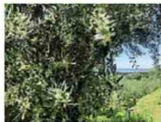
Momenti La fioritura degli ulivi fra aprile e maggio. Sono piccoli fiorellini bianchi a grappolo.